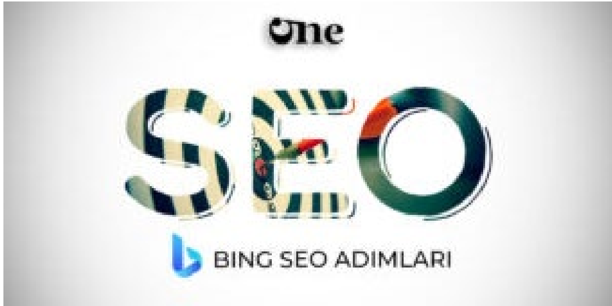
Bing SEO Adımları

Sonuç olarak, Bing SEO yapmak, web sitenizin Bing arama sonuçlarında daha yüksek sıralamalar elde etmesine yardımcı olabilir. Anahtar kelime araştırması, içerik optimizasyonu, site yapısı optimizasyonu, bağlantı oluşturma, sosyal medya kullanımı, analiz yapma, Bing Web Yöneticisi Araçları kullanma, içerik pazarlaması ve Bing reklamcılığında faydalanma gibi farklı stratejileri kullanarak Bing SEO çalışmalarınızı optimize edebilirsiniz.