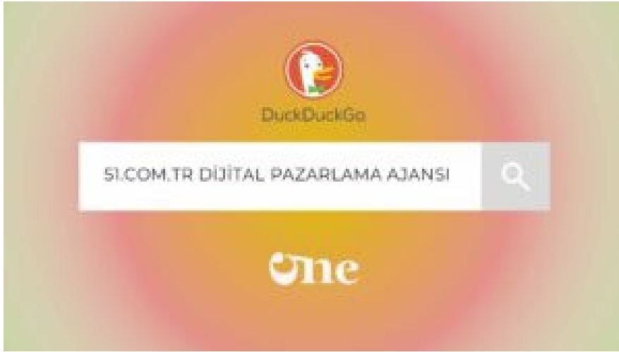
DuckDuck Go Arama Motoru Optimizasyonu Nasıl Yapılır?

Bu yöntemlerle sitenizi DuckDuckGo’da görünür hale getirebilirsiniz. Ancak, site kaydı için herhangi bir resmi kayıt programı olmadığından, sitenizin DuckDuckGo’da listelenip listelenmediğini kontrol etmek için düzenli olarak arama yapmanız gerekebilir.