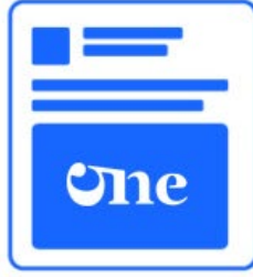
SINGLE IMAGE AD