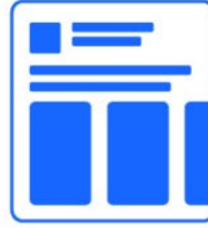
CAROUSEL IMAGE AD