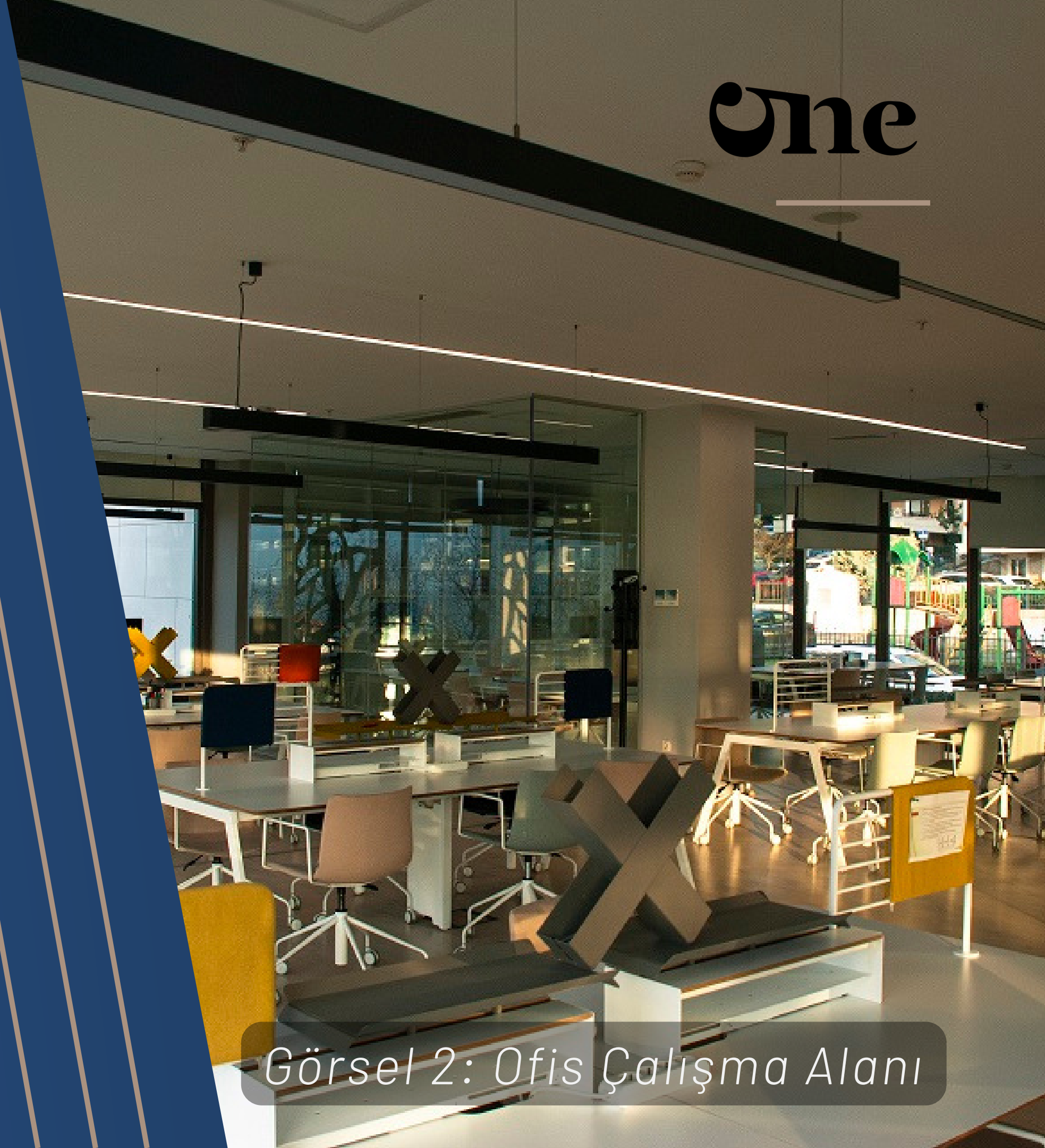
Görsel 2: Ofis Çalışma Alanı