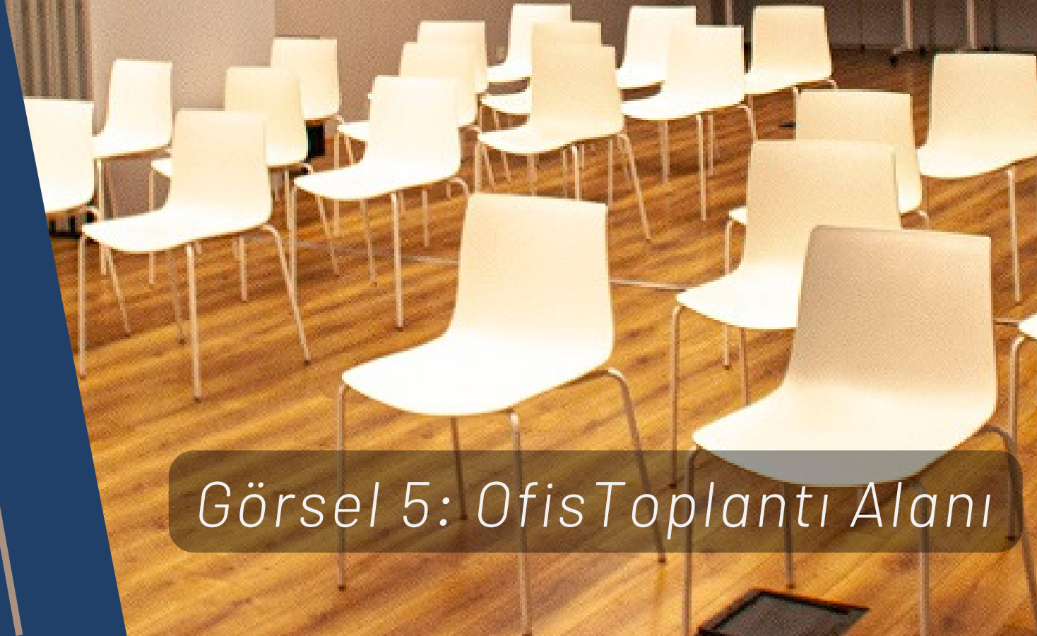
Görsel 5: Ofis Toplantı Alanı