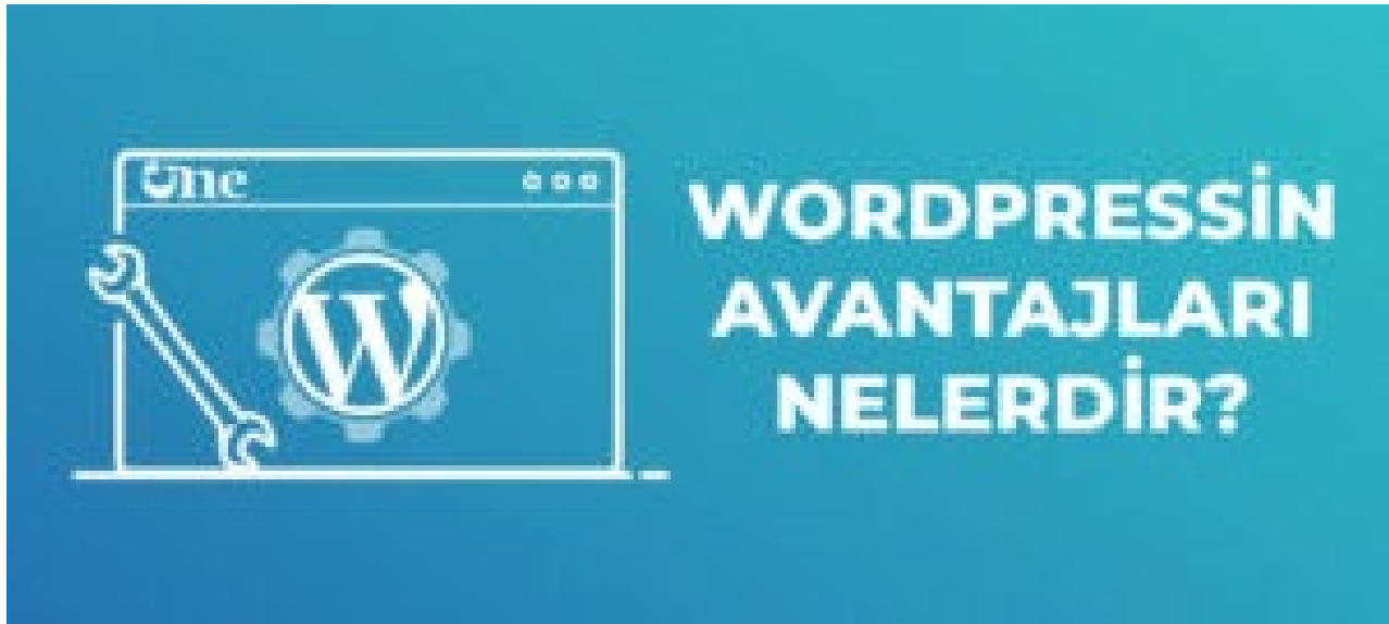
WordPress'in Avantajları Nelerdir?

Özetle, WordPress, kullanıcı dostu bir arayüz, özelleştirilebilir temalar, genişletilebilir eklentiler ve çok dilli desteği gibi çeşitli özellikler sunarak, her türlü web projesi için uygun ve esnek bir platform sağlar.